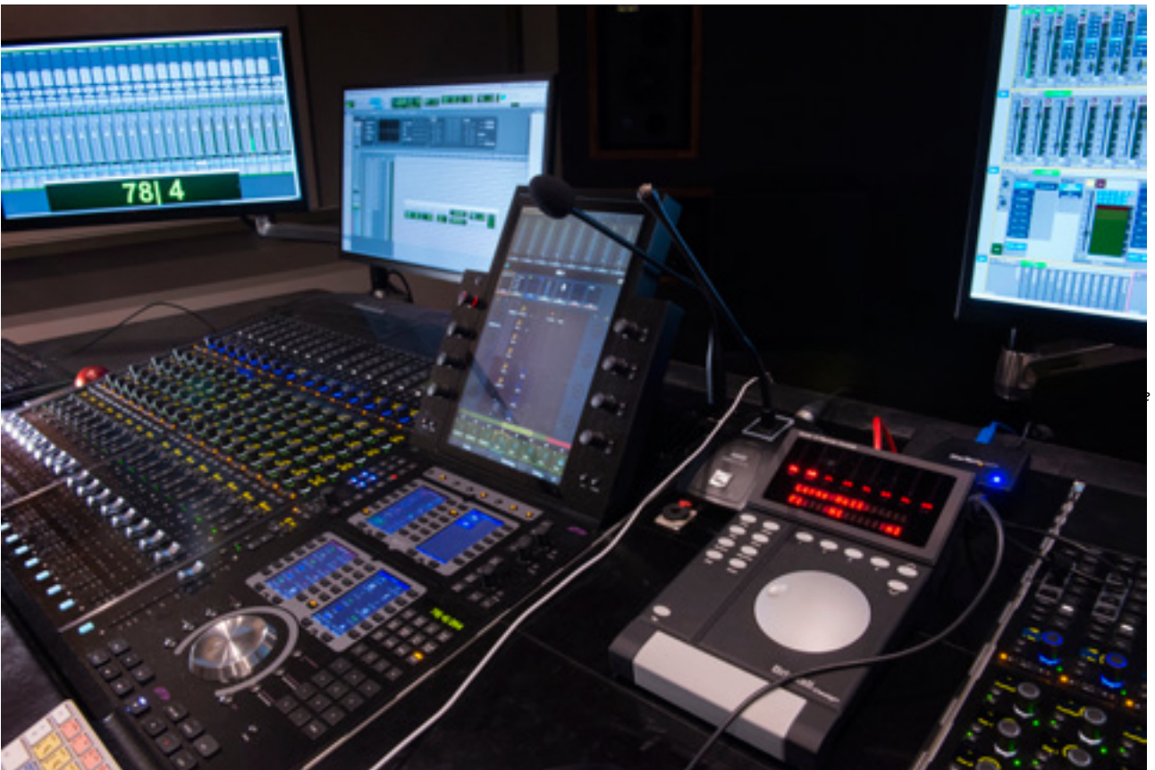
Console son