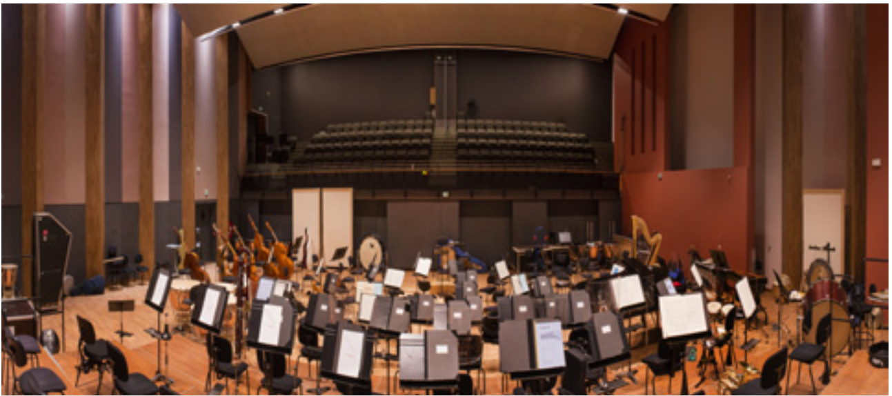
Surface de contrôle / Petite salle / Grande salle

Les entreprises ayant participé à cette formidable aventure : AVID, Areitec, ATC, Aubry Nogueira, Avenir, Coreway, CTM Solutions, Digital Audio Denmark, Extrudex, Funky Junk, Trinnov, Merging, Trinnov, Merging, Sonogama, Woodbrass, 44.1.