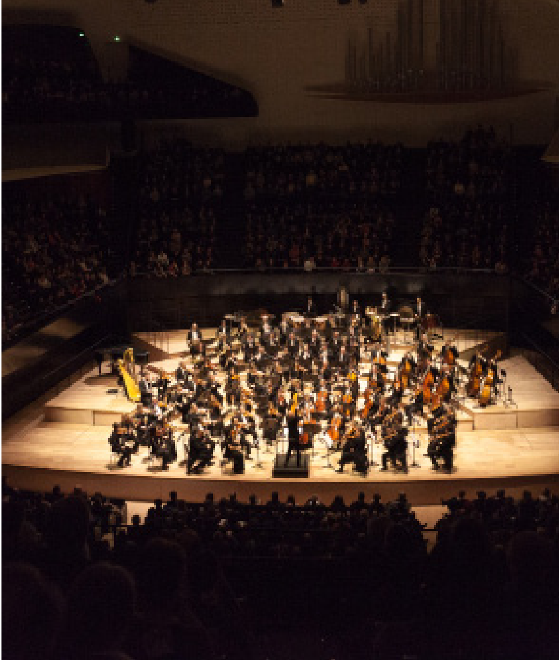
Orchestre national d'Île-de-France à la Philharmonie de Paris