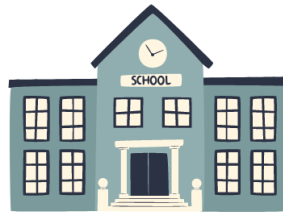
Centre de formation de Villepinte - 93