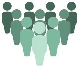
23 élèves de première