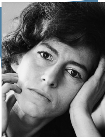
Portrait de Marceline Loridan-Ivens.

A haron Appelfeld, Imre Kertész, Primo Levi, Marceline Loridan-Ivens, Samuel Pisar, Simone Veil et Elie Wiesel font partie des grandes figures qui marquèrent la conscience collective. Ils ont donné à l'histoire de la Shoah une voix et un visage, témoignant de la diversité et de la singularité des parcours individuels durant la Seconde Guerre mondiale. Par leurs œuvres, littéraires ou cinématographiques, leurs actions sociales, politiques, éducatives, ils ont contribué à rendre l'histoire de la Shoah audible au sein de la société française. Chacune de ces sept figures, lui donnant son relief individuel, a participé au façonnement de la mémoire collective.