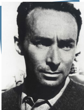
Portrait de Primo Levi. Europe, après-guerre.