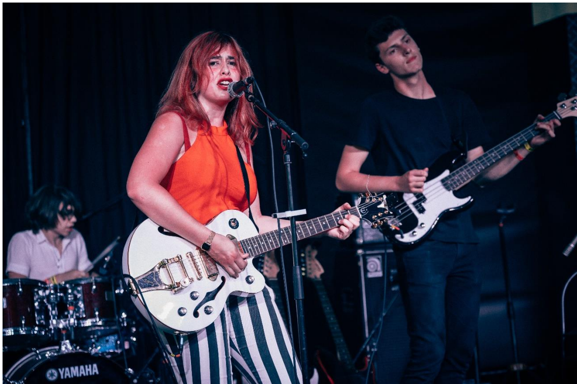
Ruby in The Rough – RES2019

En partenariat avec À QUI LE TOUR (95), L'EMPREINTE (77), PETIT BAIN (75), L'ECLA (92), MJC LES TERRASSES (78), LE RACK'AM (91) et ZEBROCK (93-94-77)