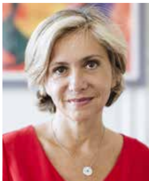
Valérie Péresse, Présidente du Conseil régional d'Île-de-France

Après deux ans de déploiement de la Stratégie #Leader, le bilan de l'action accomplie par la Région est à la hauteur des enjeux et les résultats, notamment en termes d'emplois, sont très encourageants. Ainsi, une grande partie des objectifs fixés par la Stratégie #Leader ont été atteints (87 % des actions inscrites dans la Stratégie ont été mises en place et 11 % sont en cours d'élaboration), ce qui a donné lieu à l'adoption de politiques nouvelles et ambitieuses comme la stratégie Smart Industrie, le plan Intelligence Artificielle ou la Stratégie en faveur de l'artisanat et du commerce, grâce à une transformation de la manière de conduire la politique économique régionale. Demain, nous lancerons notre nouvelle politique d'internationalisation des entreprises et la refonte de la politique de financement de l'innovation, avec le souci constant d'une plus grande lisibilité pour les entreprises et d'une efficacité renforcée.