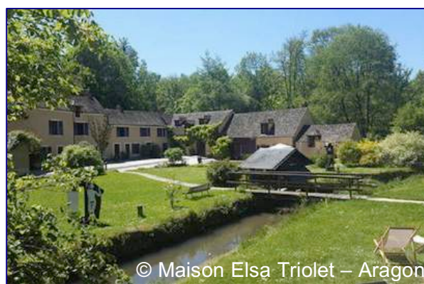
© Maison Elsa Triolet – Aragon

Suggestion : commence toutes tes phrases par « j'entendais que », « je voyais que » ou encore « je savais que ».