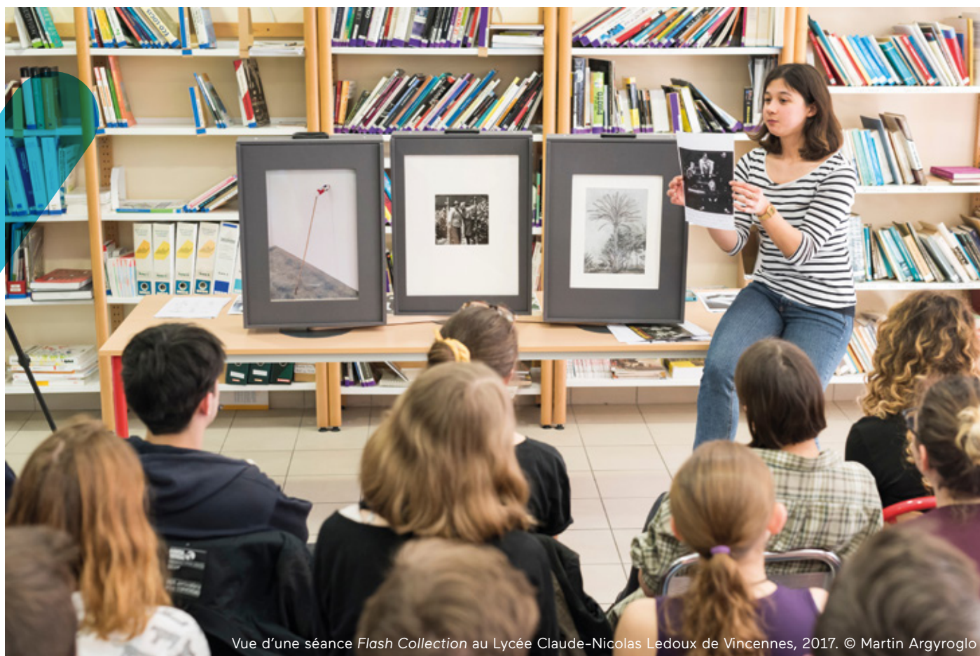
Vue d'une séance Flash Collection au Lycée Claude-Nicolas Ledoux de Vincennes, 2017.