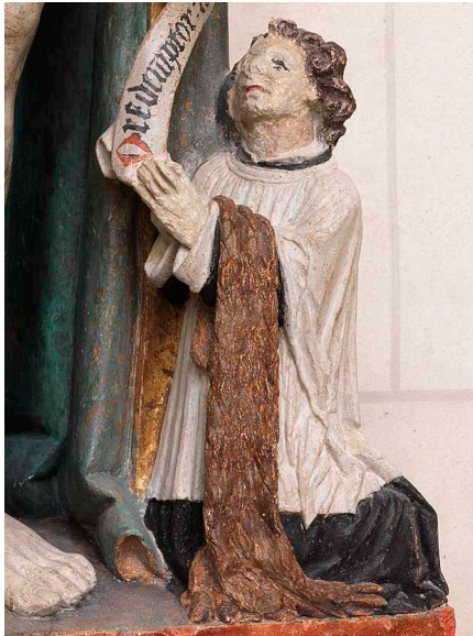
Entoure en rouge l'aumusse de ce chanoine sur la photo.

D. Lorsqu'ils viennent assister à l'office dans la cathédrale, les chanoines se reconnaissent à un signe distinctif : l'aumusse, une sorte d'écharpe en fourrure qu'ils portent sur le bras gauche.