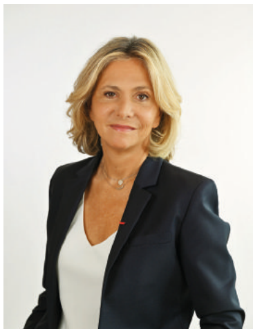
Valérie PÉCRESSE Présidente de la Région Île-de-France

Première région économique française, l'Île-de-France représente à elle seule 31 % du produit intérieur brut (PIB) de notre pays. Elle a également tous les atouts pour être la première région d'Europe. Elle bouillonne de talents, d'idées et de capitaux. Grande région urbaine et rurale, avec une population de plus de 12 millions d'habitants répartie dans huit départements dynamiques, elle dispose de lieux prestigieux qui forgent son identité – universités, grandes écoles, entreprises, musées. Elle est à la pointe de la recherche, de l'innovation et de la compétitivité. Elle est aussi la première destination touristique au monde.