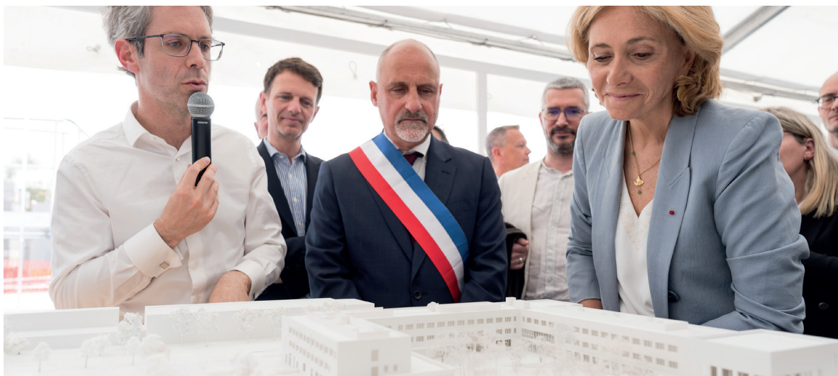
Pose de la première pierre du futur lycée Samuel-Paty à Montévrain (77) en avril 2026.