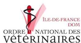
Conseil régional de l'Ordre des vétérinaires