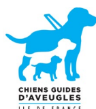
École de Chiens Guides d'aveugles d'Île-de-France