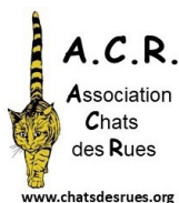
Association Chats des Rues