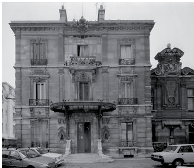
Maison d'Emile Raspail à Arcueil. Le bâtiment annexe, dédié à François-Vincent (l'inscription latine sur la façade « in patria carcer, laurus in exilio » [en prison dans sa patrie, des lauriers en exil] rappelle son destin politique), accueille la bibliothèque de l'homme politique. Ensemble inscrit au titre des Monuments historiques en 1993.

Dernier élément du décor, la remarquable balustrade de la galerie. Composée de motifs de balustre stylisé contenu dans un cadre rectangulaire vertical, elle est caractéristique du travail de ferronnerie de la seconde moitié du XVIIe siècle. Les enroulements dans chacun des cadres évoquent parfaitement le piedouche puis la panse et enfin le col d'un balustre. En outre, le centre de certains des motifs présente une croix latine surmontant un M, pour Marie.