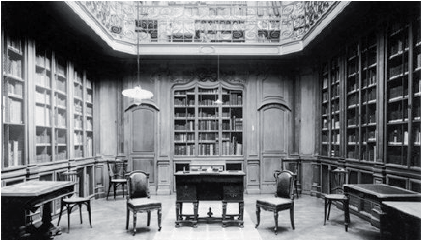
Vue intérieure de la grande salle de la bibliothèque. BnF... Carton 2, tirage photographique, vers 1920.