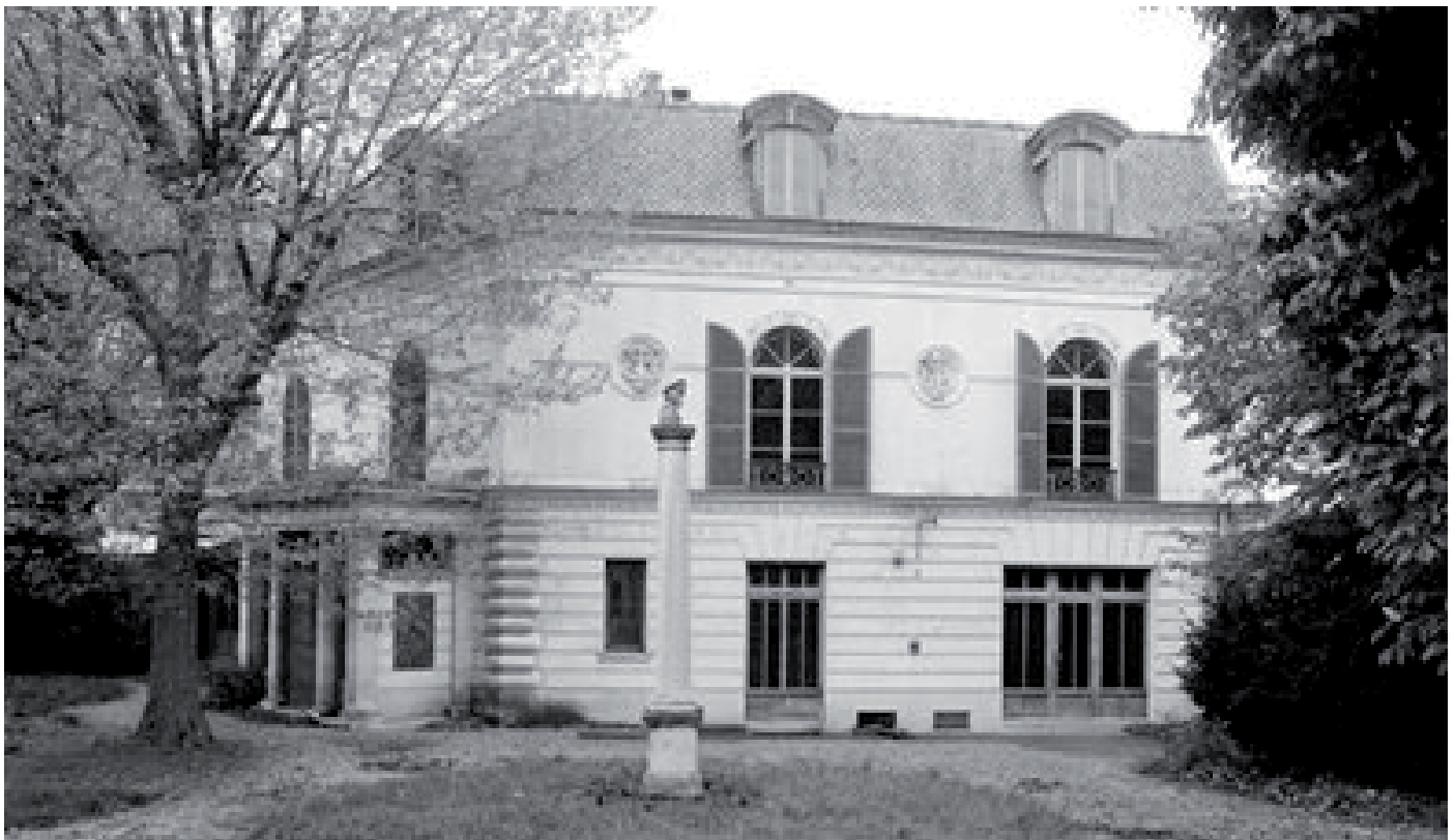
Bibliothèque Paul-Marmottan, Boulogne-Billancourt. La bibliothèque vue du jardin. Ensemble inscrit au titre des Monuments historiques en 1984. 43