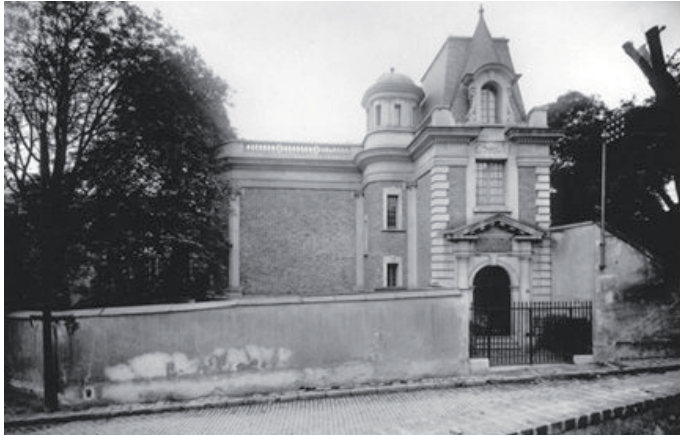
Vue extérieure de la bibliothèque depuis la rue. BnF..., Carton 2, tirage photographique, vers 1920.