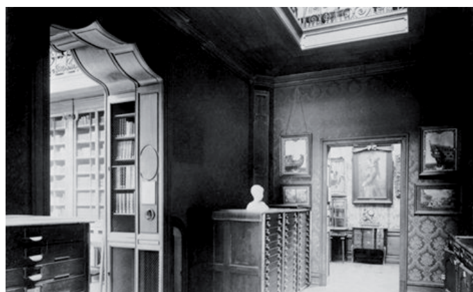
Vue intérieure du hall, espace réservé au musée. BnF... Carton 2, tirage photographique, vers 1920.

De rares descriptions nous renseignent sur les intérieurs du musée : « le visiteur ne peut encore en voir qu'une partie embryonnaire, car il est loin d'être organisé ; il ne le sera que plus tard, lorsque les donateurs seront à même de joindre à la bibliothèque un certain nombre de pièces enclavées dans les bâtiments de leur habitation personnelle. Cependant, d'ores et déjà, dès son entrée et avant d'avoir mis le pied sur la première marche de marbre blanc, le visiteur peut voir à sa gauche une vitrine garnie de terres cuites et objets antiques [...]. Dans l'escalier tournant, une série de gravures, dessins ou tableaux encadrés ornent