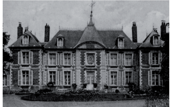
Façade sud du château de Dury (carte postale, circa 1910)

et ne prend aucune décision sans l'avoir consulté. Il est à ses yeux le spécialiste de la question, mais elle réussit aussi par ce biais à l'abstraire quelques instants de sa condition en le transportant en esprit au cœur de sa passion : les livres 28 .