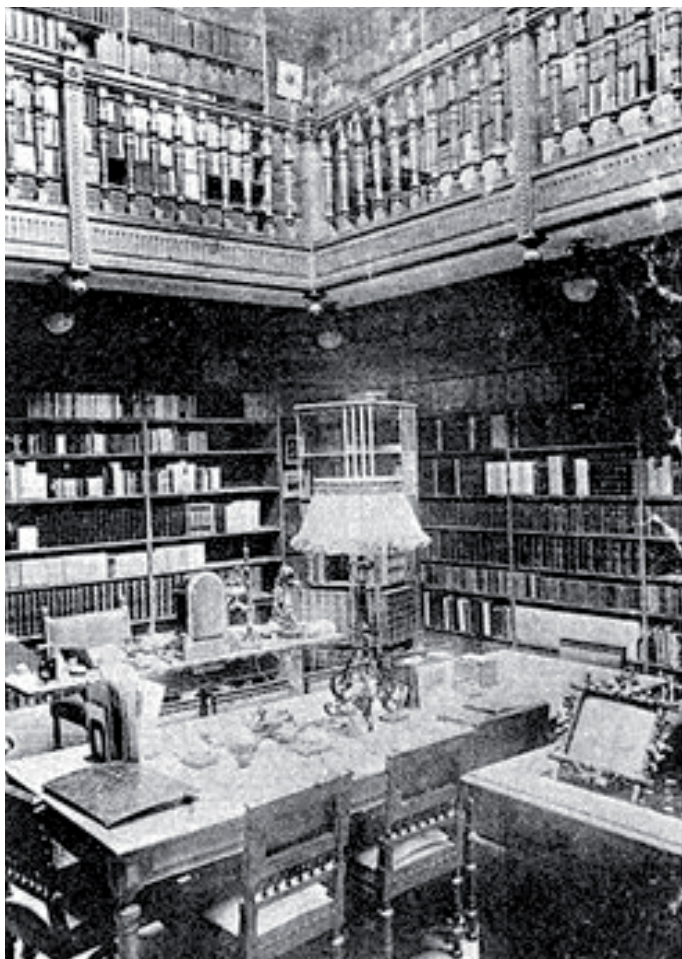
Vue intérieure de la boutique d'Honoré Champion, lorsqu'elle était encore une « librairie à chaises ». In : Jacques Monfrin. op. cit. p. 2.

Une galerie court sur son pourtour, disposition dont on trouve le premier exemple à la bibliothèque Ambrosienne de Milan en 1604 et qui devient habituelle au siècle suivant. Seule concession à la modernité, la lumière n'est plus obtenue par le rythme habituel de baies latérales, mais par un vaste éclairage zénithal. Ce parti, déjà adopté à la bibliothèque municipale d'Amiens en 1823, devient très fréquent au cours du XIXe siècle. Toutefois, ici, la verrière demeure un strict élément fonctionnel, sans véritable parti décoratif.