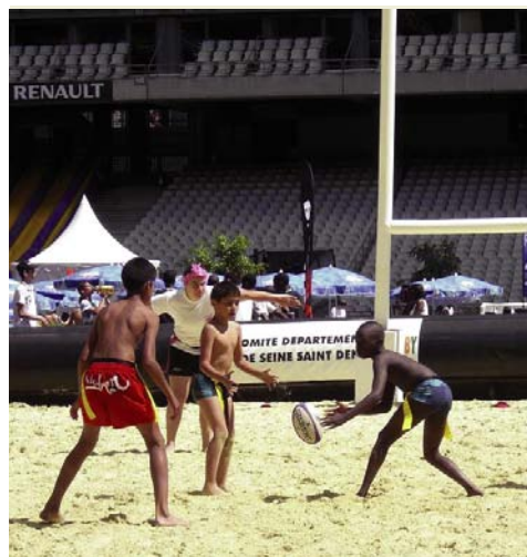
Développer de nouvelles pratiques de jeu comme le beach-rugby.

Cette initiative de la Fédération est une opportunité pour les collectivités franciliennes qui souhaitent s'équiper et permettre aux clubs, mais aussi aux élèves des écoles, collèges et lycées une pratique constante sur l'année. Deux bémols, cependant, à cette opération. La Fédération conditionne assez logiquement le co-financement des terrains à une utilisation exclusive du rugby. Une spécification qui risque de dissuader des collectivités. Si cette « clause » peut s'avérer