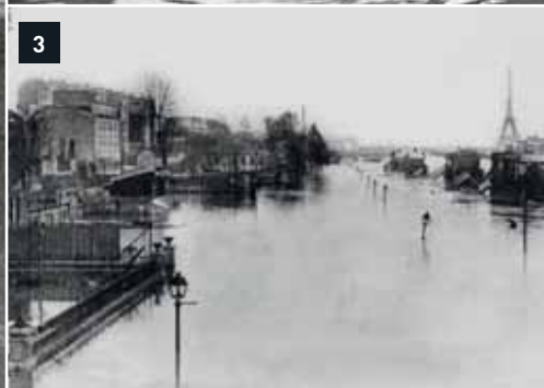
1 La rue Véron à Alfortville (94), le 29 janvier 1910, a été transformée en un canal que sillonnent les barques de secours (1), comme la gare et les quais à Choisy-le-Roi (2). À Paris, quai d'Auteuil (16 e ), seules les lanternes des becs de gaz sont visibles (3).

La grande crue de la Seine en janvier 1910 a marqué les esprits. Retour 100 ans après sur la plus grande catastrophe naturelle du xx e siècle en Île-de-France.