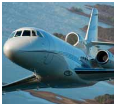
L'aviation d'affaires bénéficie du Bourget, première plate-forme européenne pour cette filière.

de permettre aux PME du secteur de surmonter leurs difficultés et d'être en harmonie avec les besoins des grands industriels. En s'associant avec le réseau des chambres de commerce et d'industrie de l'Île-de-France, AsTech a pour mission d'accompagner 200 PME-PMI à potentiel de développement, de leur donner une meilleure visibilité et de les aider à améliorer leur compétitivité. La Région accorde à AsTech une subvention de 499 800 euros pour développer la filière. ●