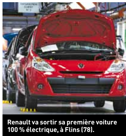
Renault va sortir sa première voiture 100 % électrique, à Flins (78).

des salariés de la filière. Enfin, la Région se fixe également l'objectif de promouvoir le renouveau de l'automobile en Île-de-France. Elle propose, par exemple, de structurer les entreprises de la filière autour du pôle de compétitivité Mov'eo, qui travaille sur les enjeux de mobilité durable. Avec l'agence régionale de développement (ARD), la Région compte également lancer un programme de promotion spécifique pour développer l'image de l'Île-de-France comme leader mondial de l'écomobilité et attirer de nouveaux investisseurs. ●