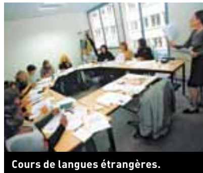
Cours de langues étrangères.

À terme, la mobilisation commune de ces trois partenaires essentiels en temps de crise pourrait toucher près de 100 000 personnes. ●