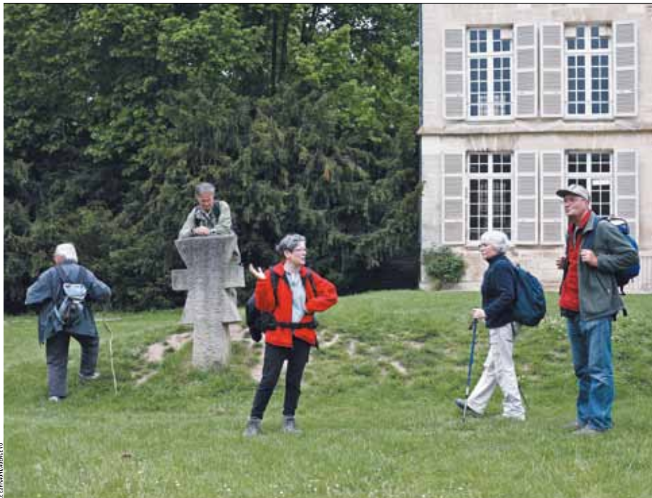
Un groupe de randonneurs de Sarcelles font une pause à la Maison du parc de Théméricourt.

Le parc naturel du Vexin, qui s'étend sur les départements du Val-d'Oise et des Yvelines, offre aux randonneurs d'innombrables balades dans les champs, les forêts et les villages au charme typique.