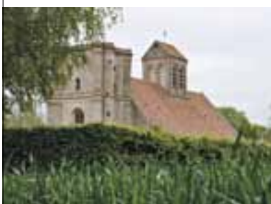
L'église de Nucourt.