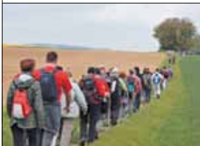
La chaussée Jules-César.