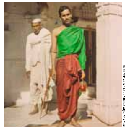
Dévôts au temple jain de Hathi Singh. Ahmedabad, 20 décembre 1913.

⊕ Du 17 juin 2008 au 30 août 2009. Musée Albert-Kahn, 14, rue du Port, 92100 Boulogne-Billancourt. Renseignements : 01 55 19 28 00.