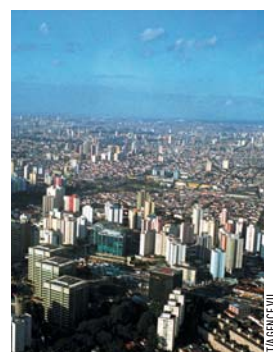
La métropole de São Paulo compte 19 millions d'habitants.

CONTACT Lutherie urbaine, 59, avenue du Général- de-Gaulle. 93170 Bagnolet. Téléphone : 01 43 63 85 42. www. lutherieurbaine. com