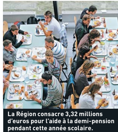
La Région consacre 3,32 millions d'euros pour l'aide à la demi-pension pendant cette année scolaire.