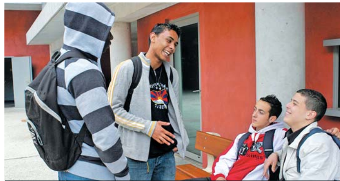
Le schéma régional de la formation encourage les 494 000 lycéens à entreprendre un parcours débouchant sur un emploi.

⊕ En savoir plus : www.iledefrance.fr , rubrique « Éducation-Formation »