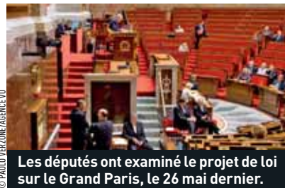
Les députés ont examiné le projet de loi sur le Grand Paris, le 26 mai dernier.

☺ Pour découvrir le projet, www.arcexpress.fr