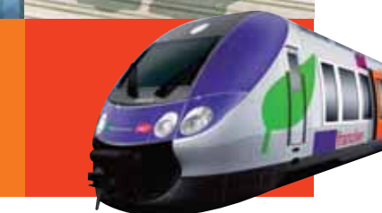
LE FRANCIEN ARRIVE